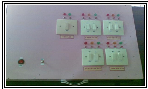
Gambar 6. Desain Alat Peraga

Dan inilah produk alat peraga yang dibuat peneliti, yang merupakan prototipe I