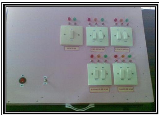
Alat Peraga yang belum direvisi

Dari hasil validasi pakar, akhirnya alat peraga mengalami revisi, dimana ukuran alat peraga tersebut diperkecil dari 50 cm x 40 cm x 10 cm menjadi 35 cm x 25 cm x 10 cm, kemudian rancangan lebih disederhanakan karena saklar utama tidak digunakan lagi, sebagai penggantinya cukup dengan saklar indikator saja yang digunakan untuk memfungsikan pernyataan negasi, konjungsi, disjungsi, implikasi dan biimplikasi, dan bel diberikan tombol terpisah agar dapat diaktifkan maupun tidak, sehingga alat peraga tersebut menjadi seperti yang terlihat pada gambar di bawah ini: